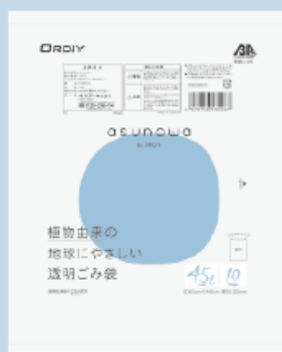
透明ごみ袋 (ツルツル)