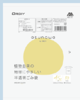
半透明ごみ袋 (シャカシャカ)