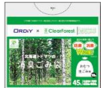
おむつ・生ごみに 45Lごみ袋