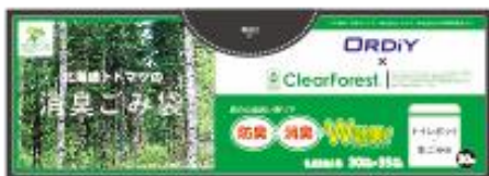
トイレポット・生ごみに 30×35cmごみ袋(黒色)