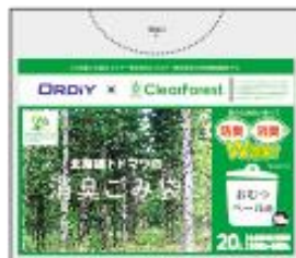
おむつペールに 20Lごみ袋