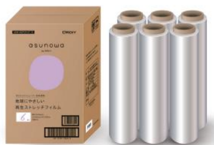
●再生原料入りの3層構造